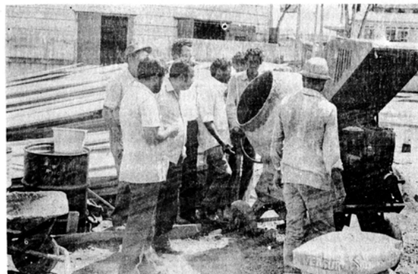
Deskundigen van de Bouwcommissie S.I.V. controleren betonsamenstelling bij de werkzaamheden die met de bouw van de Hoofdmoskee aan de Keizerstraat verband houden.